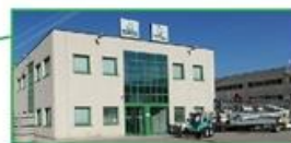
TECNOEDIL NOLEGGI S.R.L. Via Praga, 1 - Spini di Gardolo 38121 Trento (TN) Tel. 0461/990748